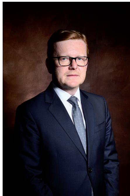
doc. JUDr. PhDr. Petr Mlsna, Ph.D. předseda Úřadu pro ochranu hospodářské soutěže

Přes tato zjevná pozitiva, která zákon zemědělcům a potravinářům přinesl, spatřujeme na jejich straně poměrně pasivní přístup. Většinu správních řízení totiž Úřad zahajuje na základě vlastních šetření. Proto bychom uvítali aktivnější roli dotčených subjektů při podávání podnětů a oznamování podezření na porušení zákona.